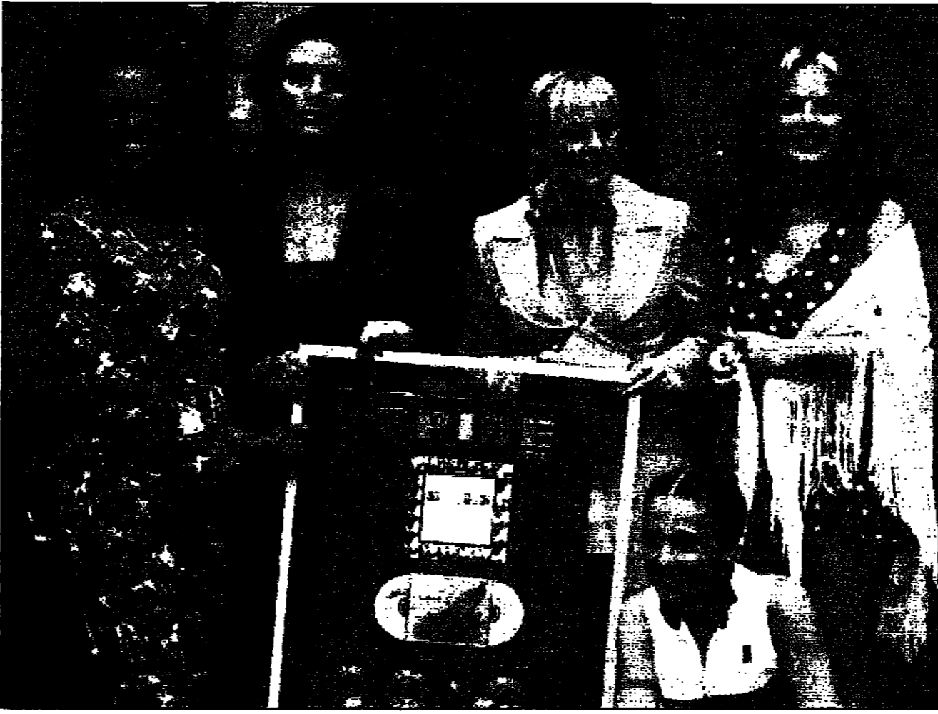
مشوات فرقة البوب البريطانية المشهورة سبلماسي فيزيار، يقفن حول جازة حصان عليها بمناسبة بيع آخر اليوم لهن أكثر من مليون نسخة